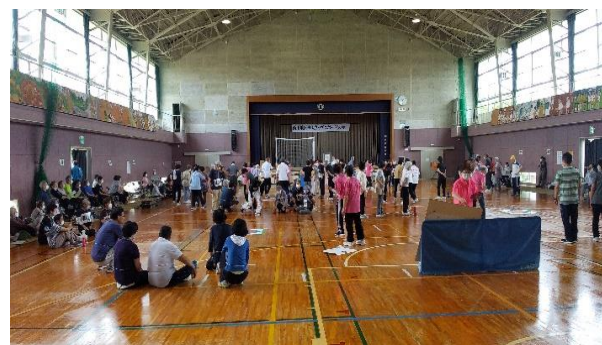
5月25日 男の茶の間を考えた「民生児童委員定例会」